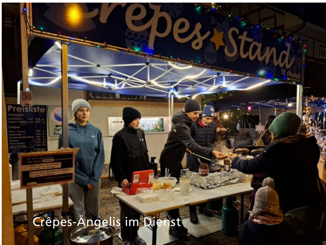
Crêpes-Ängelis im Dienst