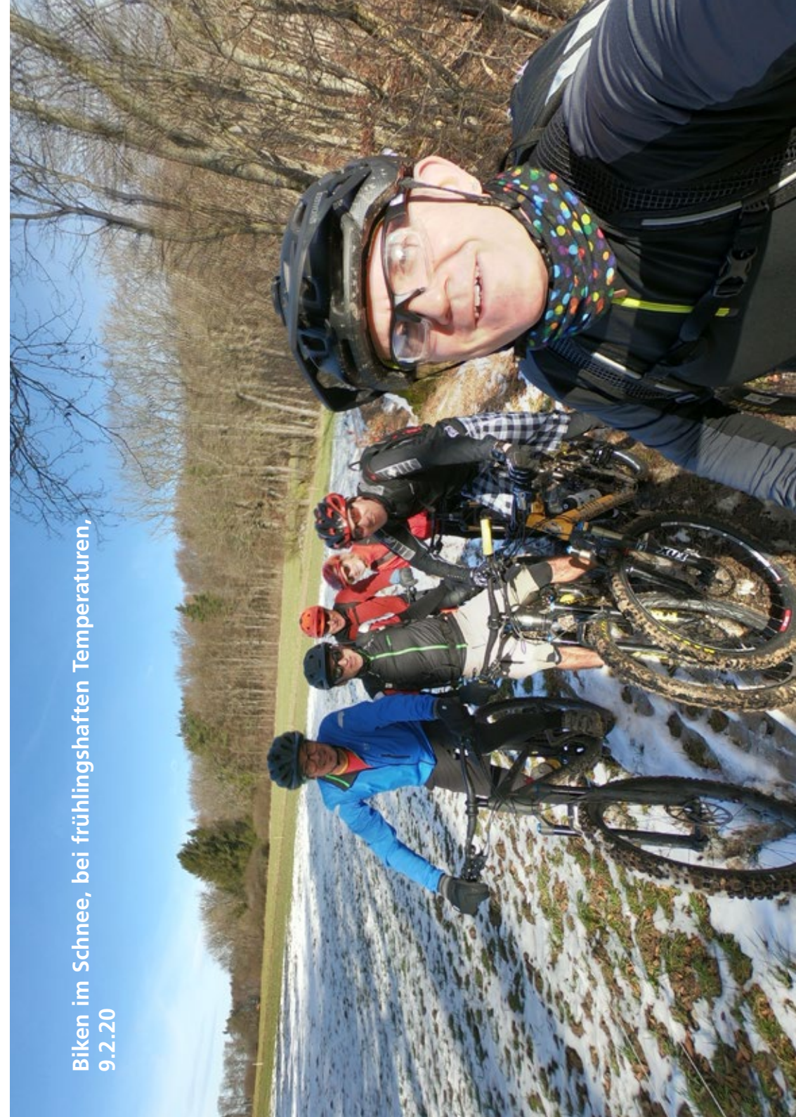
Biken im Schnee, bei frühlingshaften Temperaturen, 9.2.20

Versicherung ist Sache der Teilnehmer/innen.